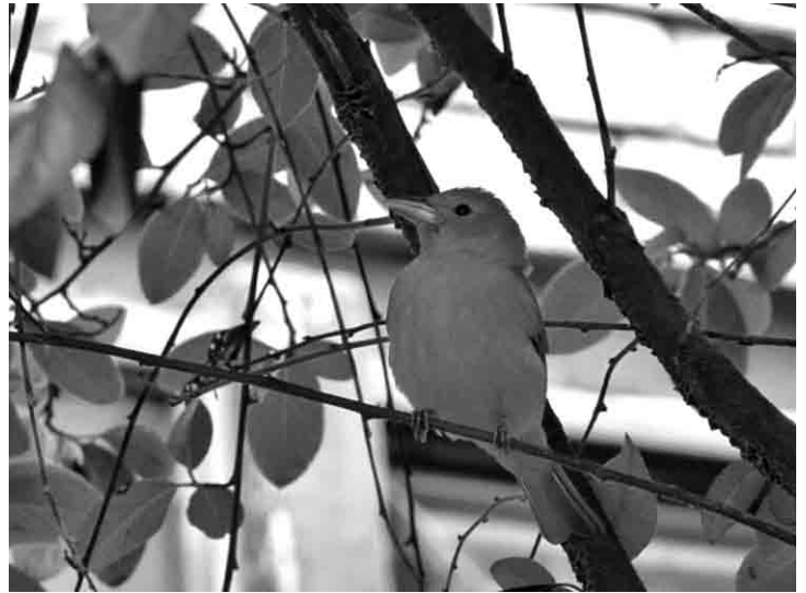
Fotografía tomada por un vecino del colegio Altamira Sur Oriental de Bogotá. El ave que se aprecia en la fotografía se denomina "Tangara veranera", ave migratoria que no es frecuentemente vista en la zona y que se logró identificar durante el desarrollo del proyecto.